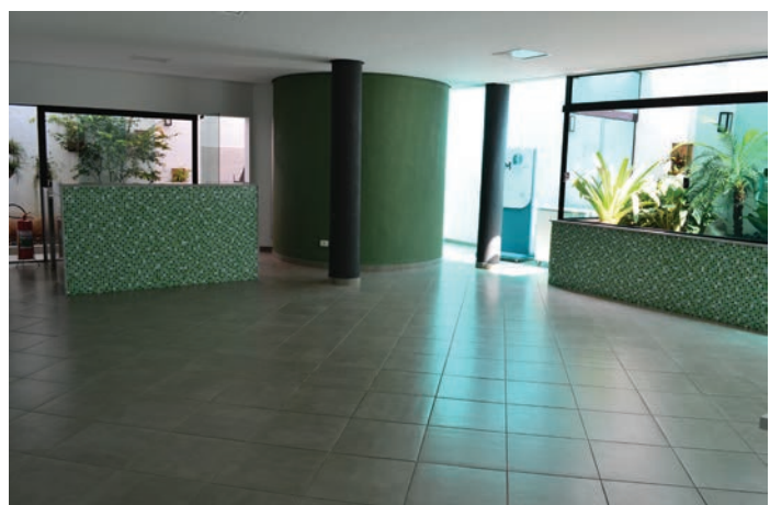
Espaço social com bar e área para churrasco