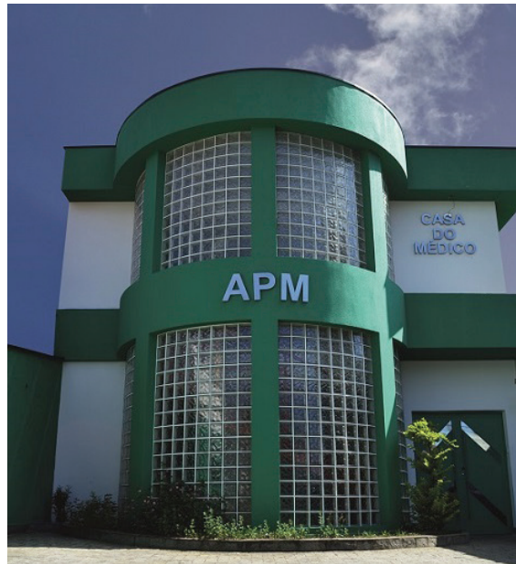
Sede moderna, ampla, com completa infraestrutura

Entendemos que o relacionamento entre os colegas é um dos pontos mais importantes de nossa atenção, então temos uma programação com encontros presenciais, em parceria com as regionais de São Bernardo e São Caetano, que aguardam a pandemia permitir; seriam três encontros esportivos ao ano, nove jornadas de atualização médica, três encontros culturais e três jornadas de defesa profissional. Além disso, a Regional Santo André fará diversas reuniões pela internet para Atualização Médica e atualizará o site e as ações por redes sociais para melhorar a comunicação com a classe. Queremos retomar o Encontro de Dirigentes Hospitalares do ABC e fazer ações de acolhimento ao novo associado (ambos, um ou dois por ano). Alguns cursos que planejávamos fazer presenciais terão que ser adaptados para a internet: Planejamento Financeiro Pessoal e Preparo para Telemedicina. Mas para maior acerto das nossas ações, vamos fazer uma pesquisa do Perfil do Médico do ABC, um questionário simples que tomará de 3 a 5 minutos para ser respondido, mas cuja tabulação norteará nossas ações, podendo até mexer na programação acima; é muito importante a participação do maior número de médicos possível, para o acerto das nossas decisões.