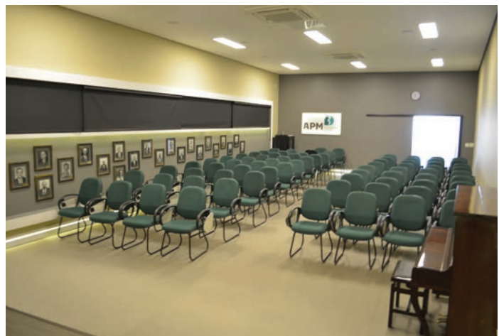
Anfiteatro para 150 pessoas